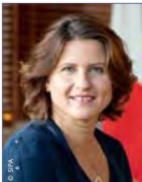
Roxana Maracineanu Ministre des Sports

Le sport est à la fois un enjeu et un symbole. Un enjeu de santé, de bien-être, d'éducation, de cohésion sociale mais aussi un symbole de liberté.